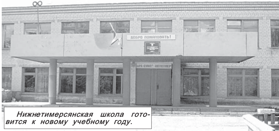
Нижнетимерсянская школа готовится к новому учебному году.