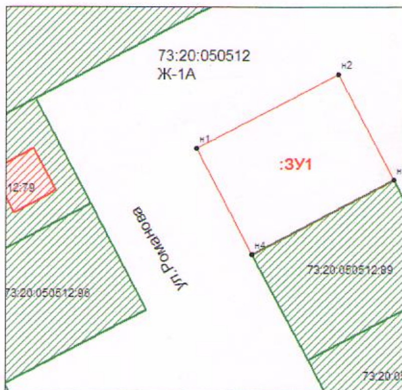
Схема на КИП