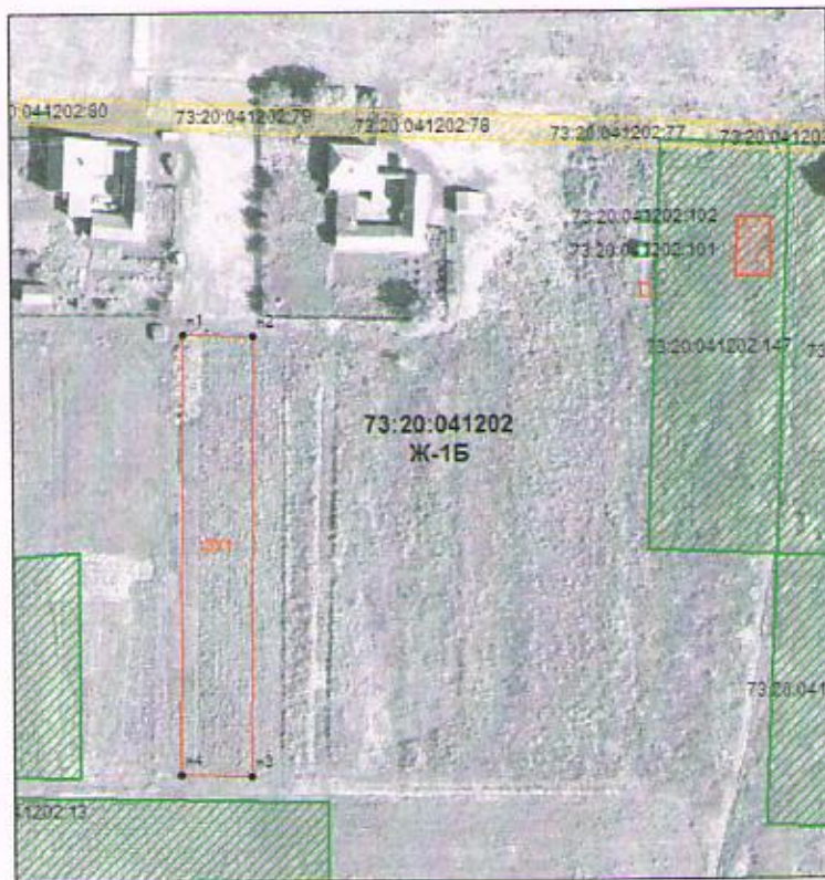
Схема на КИП